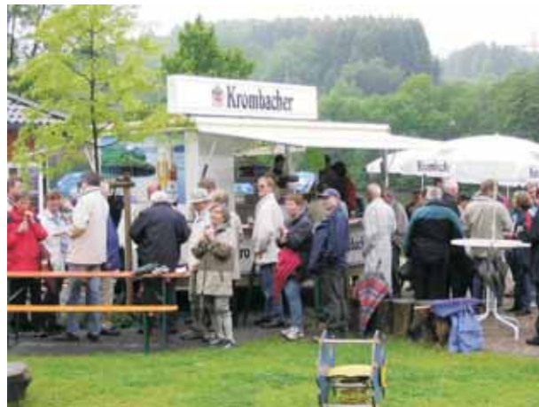
Eröffnung Rundwanderweg Obersee Mai 2004

Das Instrument „Stadtmarketing“ bietet die perspektivische Chance die verschiedenen „Stadtakteure“ nicht nur für einmalige Projekte, sondern kontinuierlich im gesamtstädtischen Interesse zusammenzuführen und so Kräfte permanent zu bündeln.