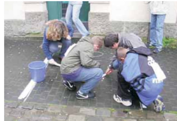
Kaugummiaktion „Was spuckst Du?“ Juli 2004

Heutzutage stehen die Kommunen in verstärkten Wettbewerbsbeziehungen untereinander als Standorte für Industrie und gewerbliche Ansiedlungen, als Arbeits-, Wohn- und Einkaufsstandorte sowie als Platz für kulturelle Aktivitäten.